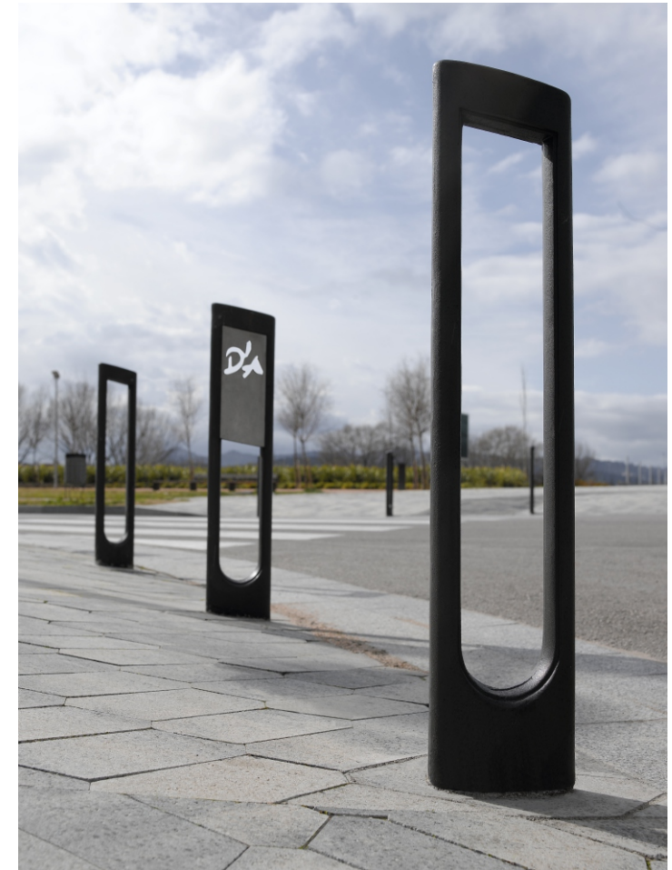
Platja d'Aro ( Girona )